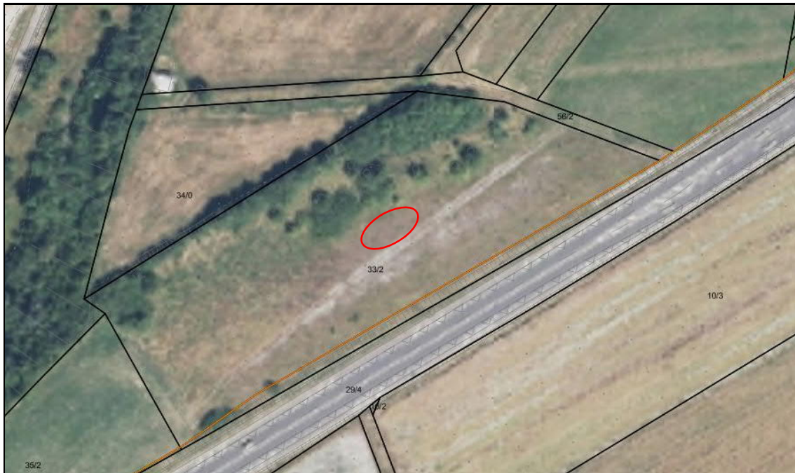
Abb. 2: Bereich des Vorkommens der Gewöhnlichen Kugelblume

Als seltene und nach § 7, Nr. 13 u. 14 BNatSchG besonders geschützte Pflanzenart wurde im mittleren Bereich des Halbtrockenrasens die Gewöhnliche Kugelblume ( Globularia punctata , RL RP 2, RL D 3) nachgewiesen (s. Abb. 2).