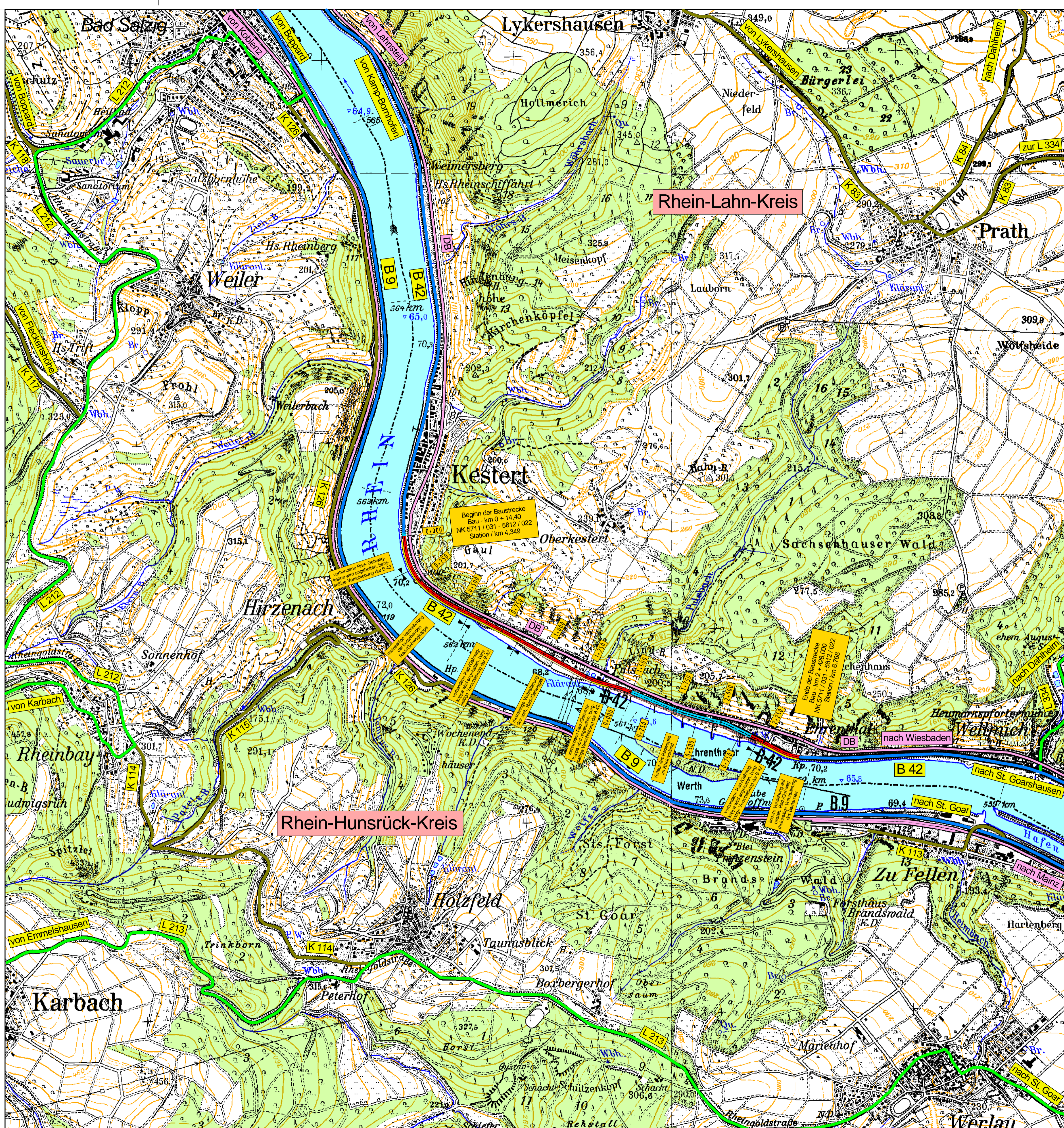
Übersichtskarte M 1 : 100.000