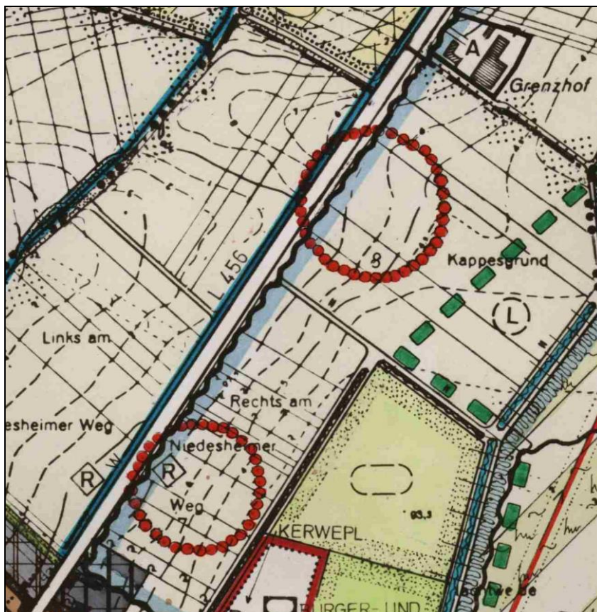
Grabungsschutzgebiete nördlich Großniedesheim gemäß Darstellung im Flächennutzungsplan II der Verbandsgemeinde Heßheim

Im Flächennutzungsplan der früheren Verbandsgemeinde Heßheim sind die vorliegenden Erkenntnisse über archäologische Fundstellen im Untersuchungsgebiet verankert. Demnach sind archäologische Fundstellen im Bereich nördlich von Großniedesheim östlich der L 456 bis zum Grenzhof zu erwarten.